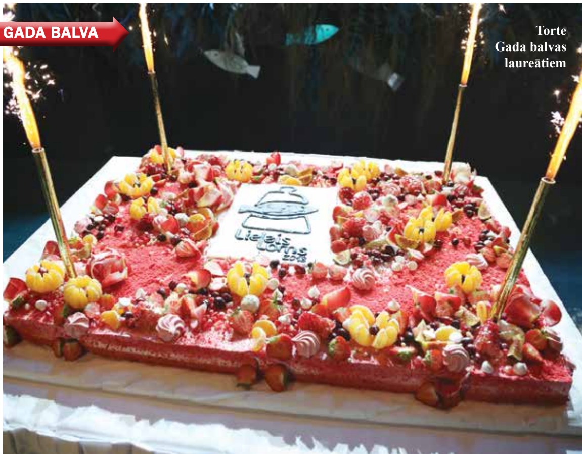
Torte Gada balvas laureātiem