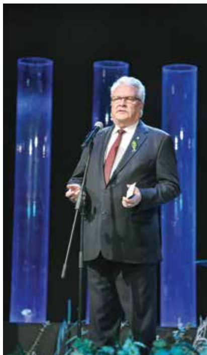
Gada balvas “Lielais loms” apbalvošanas ceremonijas dalībniekus sveic zemkopības ministrs Jānis Dūklavs