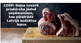
LOSP: Gaļas nozarē priekšroka jādod uzņēmumiem, kas pārstrādā Latvijā audzētus lopus