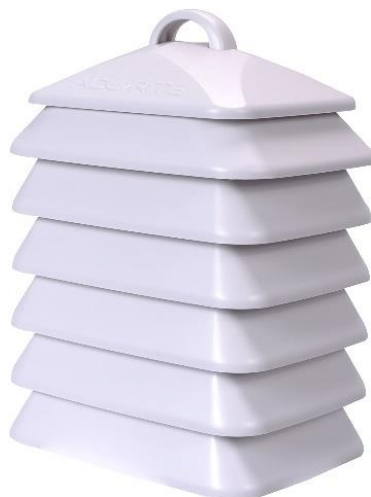
2.6. attēls AccuRite kompānijas ražots saules starojuma ekrāns

Temperatūras mērījumu tausti tika izvietoti zem AccuRite kompānijas ražotiem saules starojuma ekrāniem, 2.6. attēls.