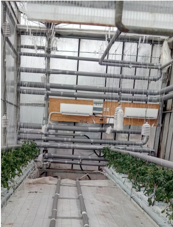
2.1. attēls Iekšējā siltummaiņa atrašanās vieta