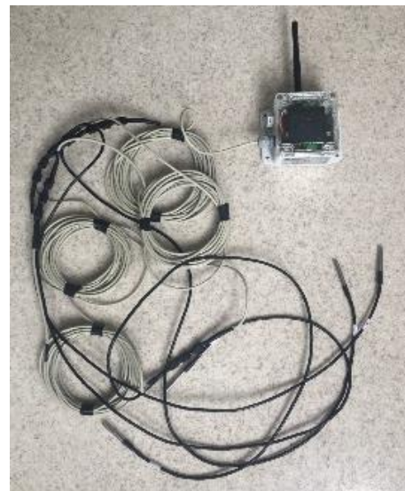
2.4. attēls Qualcomm rindas ARM procesors bez un ar pieslēgtiem sensoriem

Projekta laikā tika eksperimentēts ar rindu atvērtā koda reālā laika operētājsistēmām, pirmo mērītāja iterāciju eksperimentāli izveidojot izmantojot ChibiOS kodu.