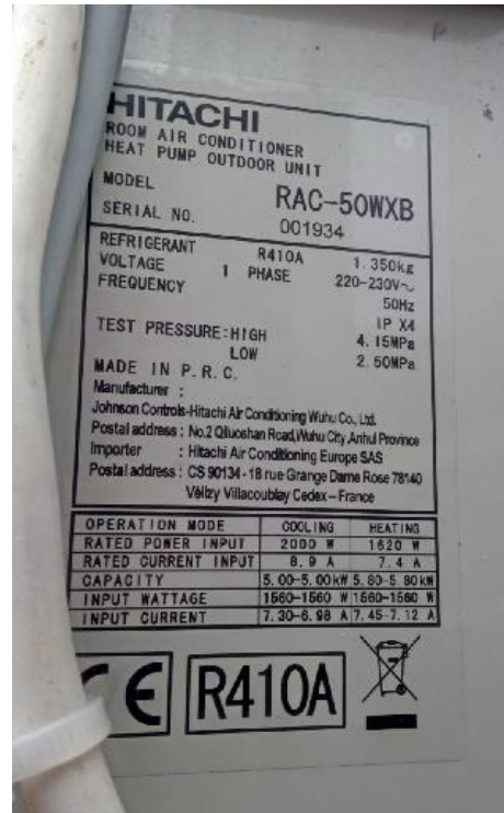
2.2. attēls Gaiss –gaiss tipa siltumsūkņa Hitachi RAC – 50 WXB parametri

Pētījumā izmantots uzņēmuma Hitachi-Johnson Controls Air Conditioning, Inc ražoto reverso gaiss-gaiss tipa siltumsūkni HITACHI RAC-50WXB ar sildīšanas jaudu 5.00 kW un dzesēšanas jaudu 5.80 kW (2.2. attēls).