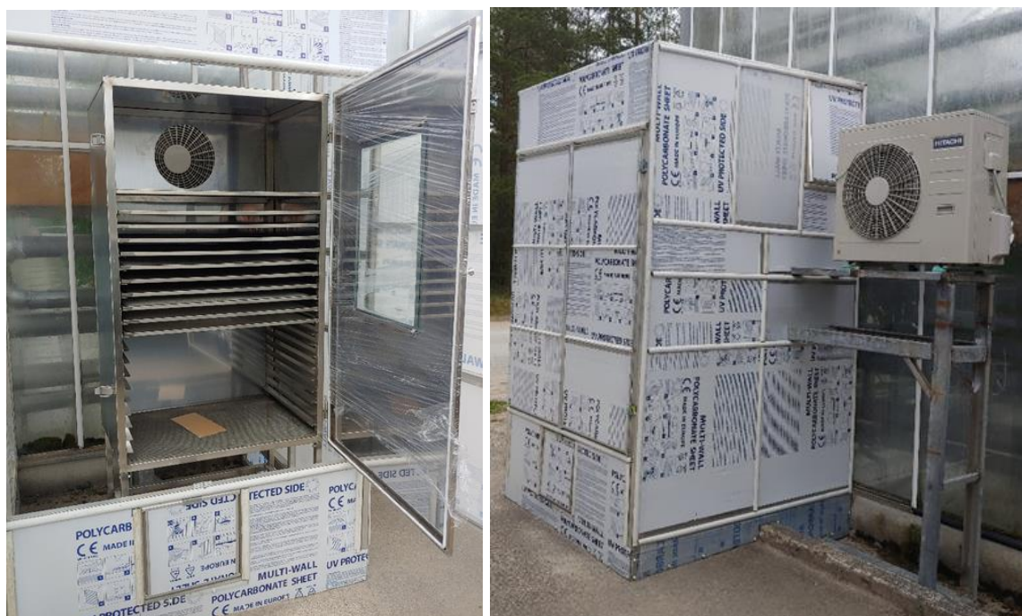
2.9 attēls Žāvēšanas iekārtas iekštelpa un gaisa recirkulācijas konstrukcija

Žāvēšana notika cikliski ar vienas diennakts cikla garumu, jo žāvēšana tika veikta periodos, kad siltumnīcas iekšējā gaisa temperatūra bija virs uzstādītās tomātu optimālās gaisa temperatūras dienā +24°C un naktī +21°C.