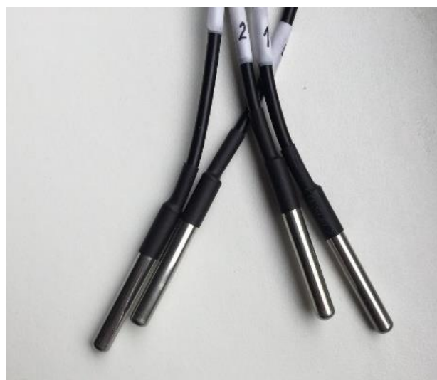
2.5. attēls Temperatūras tausti DS18B20