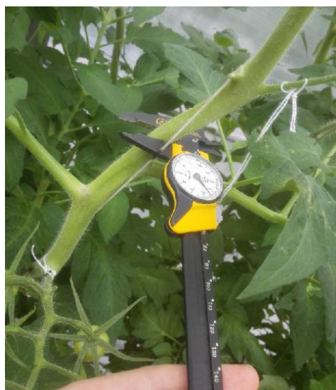
2.3. attēls Tomātu stiebra diametra mērīšana

Augu veģetācijas laikā tika veikti tomātu augšanas novērojumi. Reizi nedēļā gan ražošanas gan eksperimentālajā siltumnīcā pieciem brīvi izraudzītiem, bet vieniem un tiem pašiem augiem tika mērīts augu stiebru garuma pieaugums, lapu plātnes garuma izmaiņas, ķekaru skaits un attālums starp tiem, kā arī mērītas stiebra diametra izmaiņas (2.3. attēls).