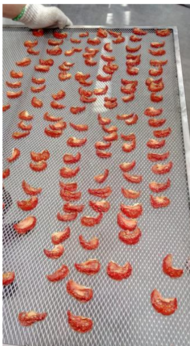
2.10. attēls Izžāvētā produkcija

Žāvēšanas iekārtas recirkulācijas konstrukcijai bija izveidotas regulējamas atveres gaisa apmaiņai ar apkārtējo vidi, kā rezultātā tika panākti optimāli žāvēšanas nosacījumi.