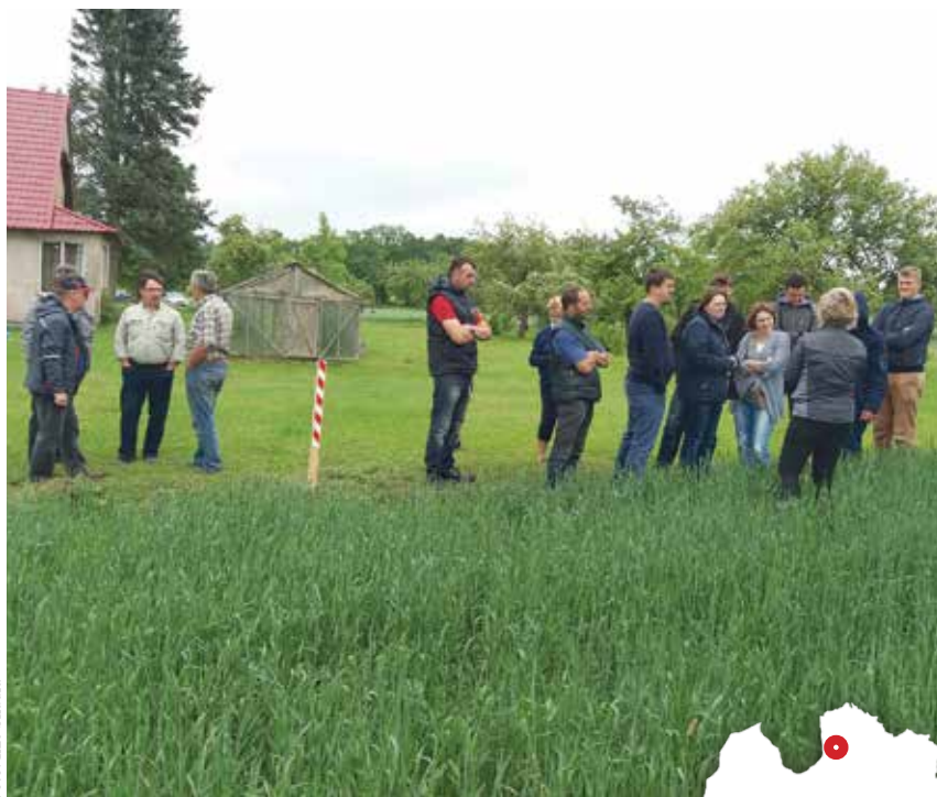
Lauka diena SIA "Paparžkalni"