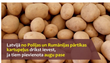
Latvijā no Polijas un Rumānijas pārtikas kartupeļus drīkst ievest, ja tiem pievienota augu pase