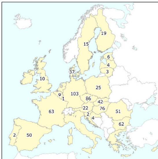
Number of intervention storage places in the EU28

Eiropas Komisija (EK) apzinājusi katras dalībvalsts un kopumā ES infrastruktūru, kas attiecas uz graudu importu un eksporta iespējām. Latvijā šobrīd apzināti 4 intervences centri ar kopējo kapacitāti ap 322 tūkstošiem tonnu.