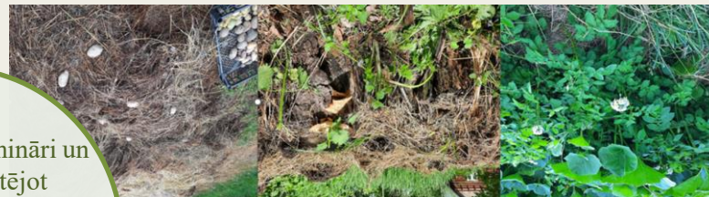
Attēls. Permakultūra-Sienā audzēti kartupeļi, biedrība «Zaļā krūze»

Organizē pašvaldība, piesaistot jomas ekspertu