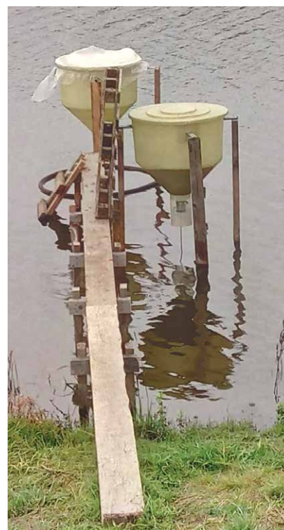
Pieejamas dažādas konstrukcijas un ietilpības zivju barotavas

Arvien populārākas kļūst pendeļveida zivju barotavas , kas būtiski atvieglo zivju barošanu vasarā, kad bieži vien visādu darbu pilnas rokas, un pie dīķa sanāk pieiet reizi nedēļā, citreiz pat retāk. Ja zivis netiek barotas, tās, protams, augs daudz lēnāk, vai, ja dīķī zivju būs ļoti daudz, cerēto pieaugumu rudenī var arī nesagaidīt. Šīs barotavas vairāk piemērotas karpveidīgajām zivīm, lašveidīgajām mazāk, jo pēdējās mēdz ar šīm barotavām “spēlēties” un “izdauzīt” no barotavas barību vairāk, nekā spēj apēst, un izveidot zem barotavas barības kalnu, kas sāk ūdenī bojāties. Šo barotavu lielais pluss ir tāds, ka zivis pašas, piepeldot pie barotavas, var sevi “apkalpot”, proti, sistēma šeit ir tāda: dīķa gruntī ir iedzīti trīs mietīti (50 x 100 mm šķērgriezumā) tā, lai mietu gali ir aptuveni metru virs ūdens. Uz šiem mietiem uzliek barotavu-tvertni, no kuras ūdenī ieiet metāla stienītis – pendelis vai svārsts. Pendeļa augšpusē ir neliels šķīvītis, kurš, atrodoties miera stāvoklī, tvertnē esošajai barībai neļauj birt ūdenī. Šo svārstu pakustinot, ūdenī no šķīvīša iebirst nedaudz no barotavā iebērtās barības. Iebīrušo barību zivis uzreiz apēd,