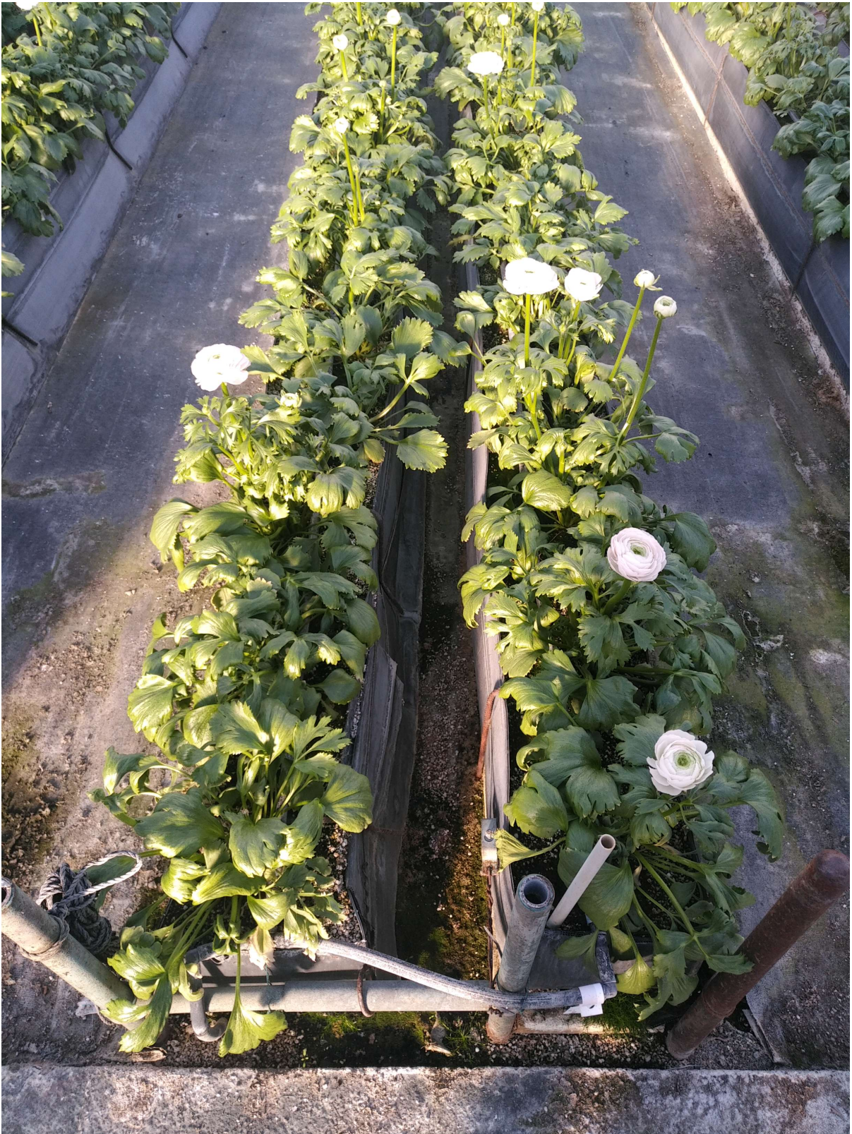
Ziedu kātu garums tiek izvēlēts atkarībā no noieta tirgus prasībām.