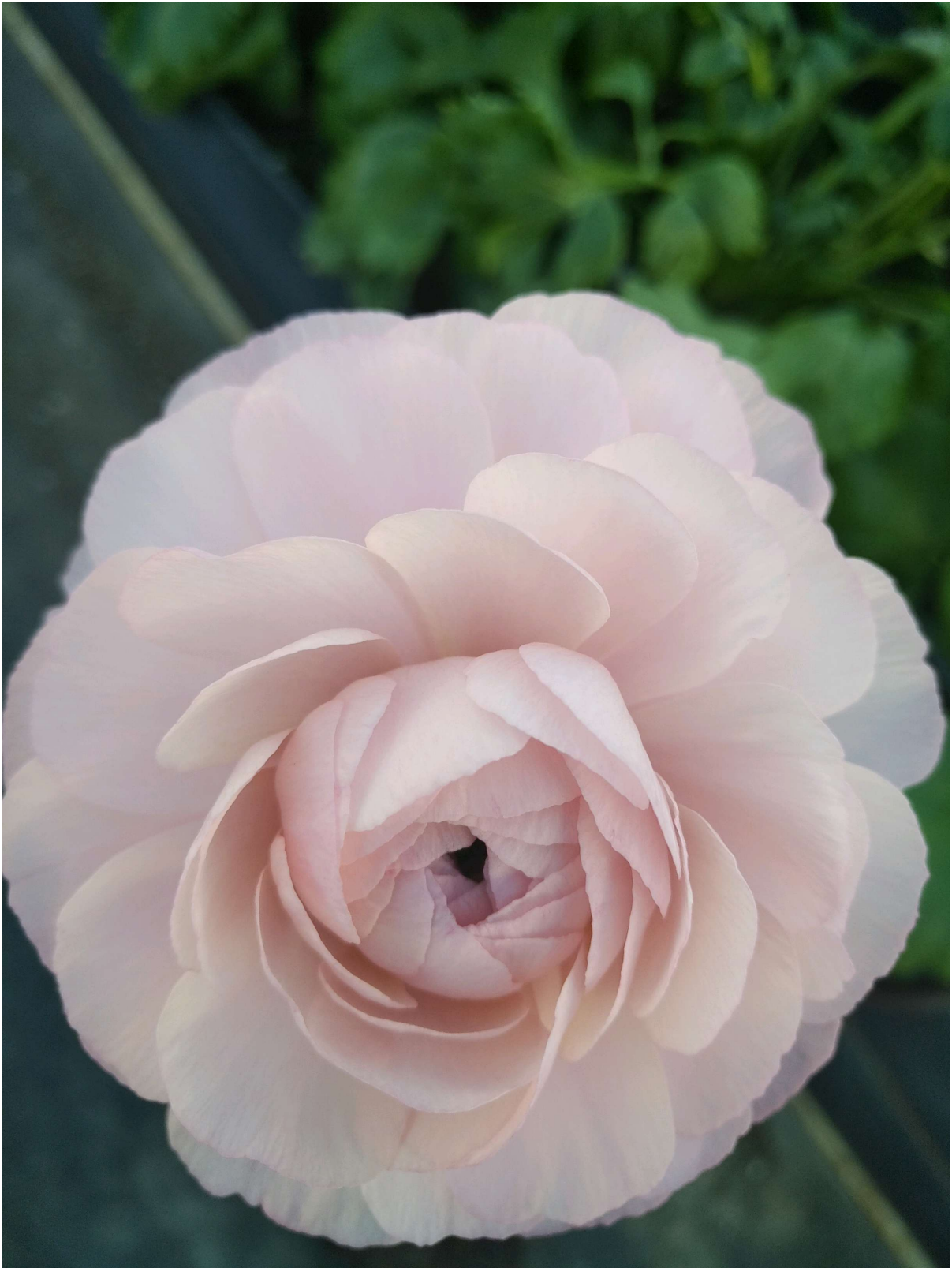
Papildus audzētava audzē rice flower, kas uzzied aprīlī, maijā, pagarinot sezonu, jo gundegas uz to laiku jau nozied..