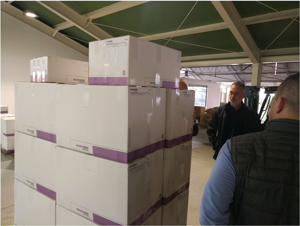
Vienā kaste ir vērtā ap 6000 eur, ap 20000 sakneņi