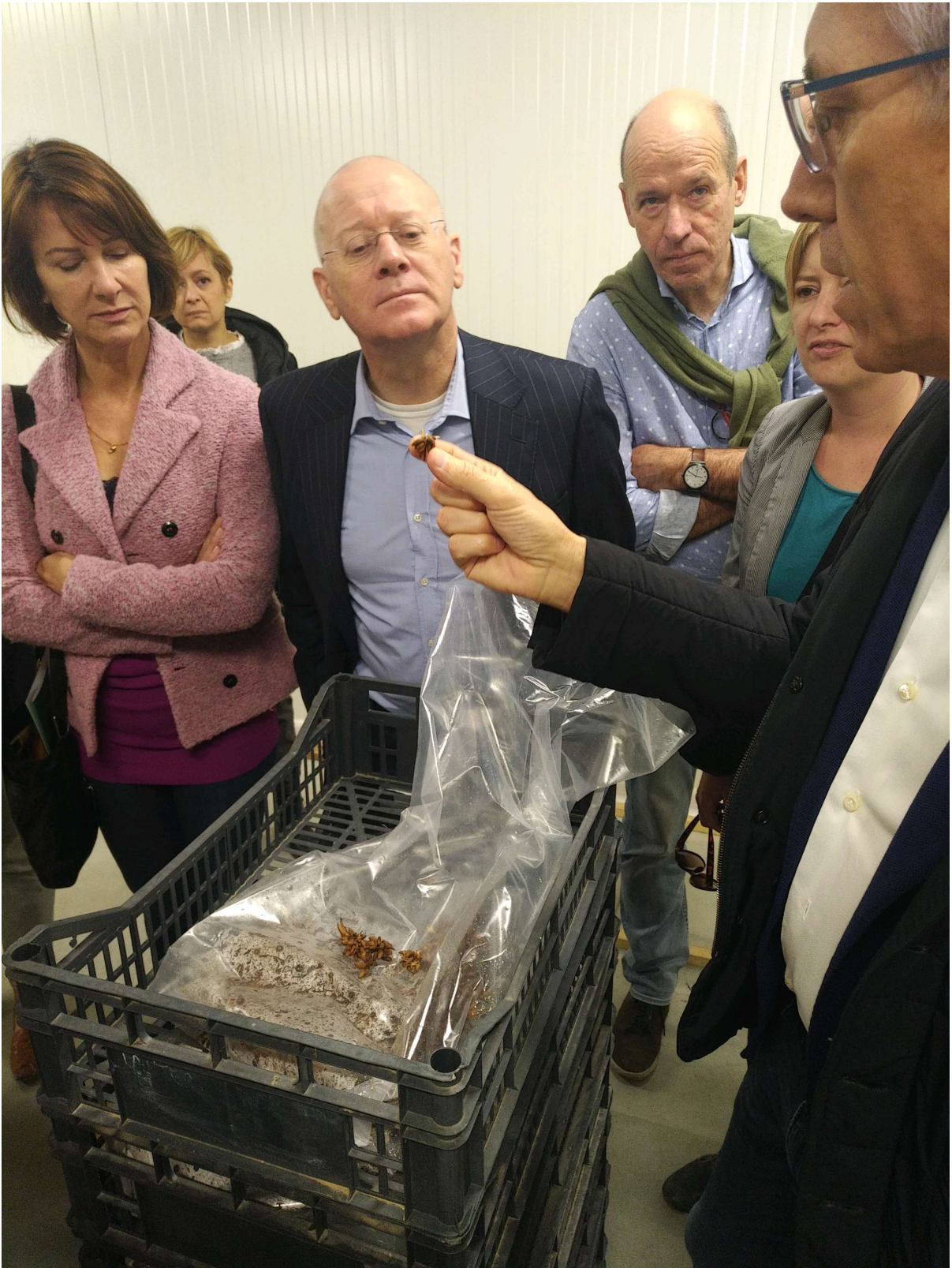
Viena sakneņa cena ir ap 0.30-0.45eur