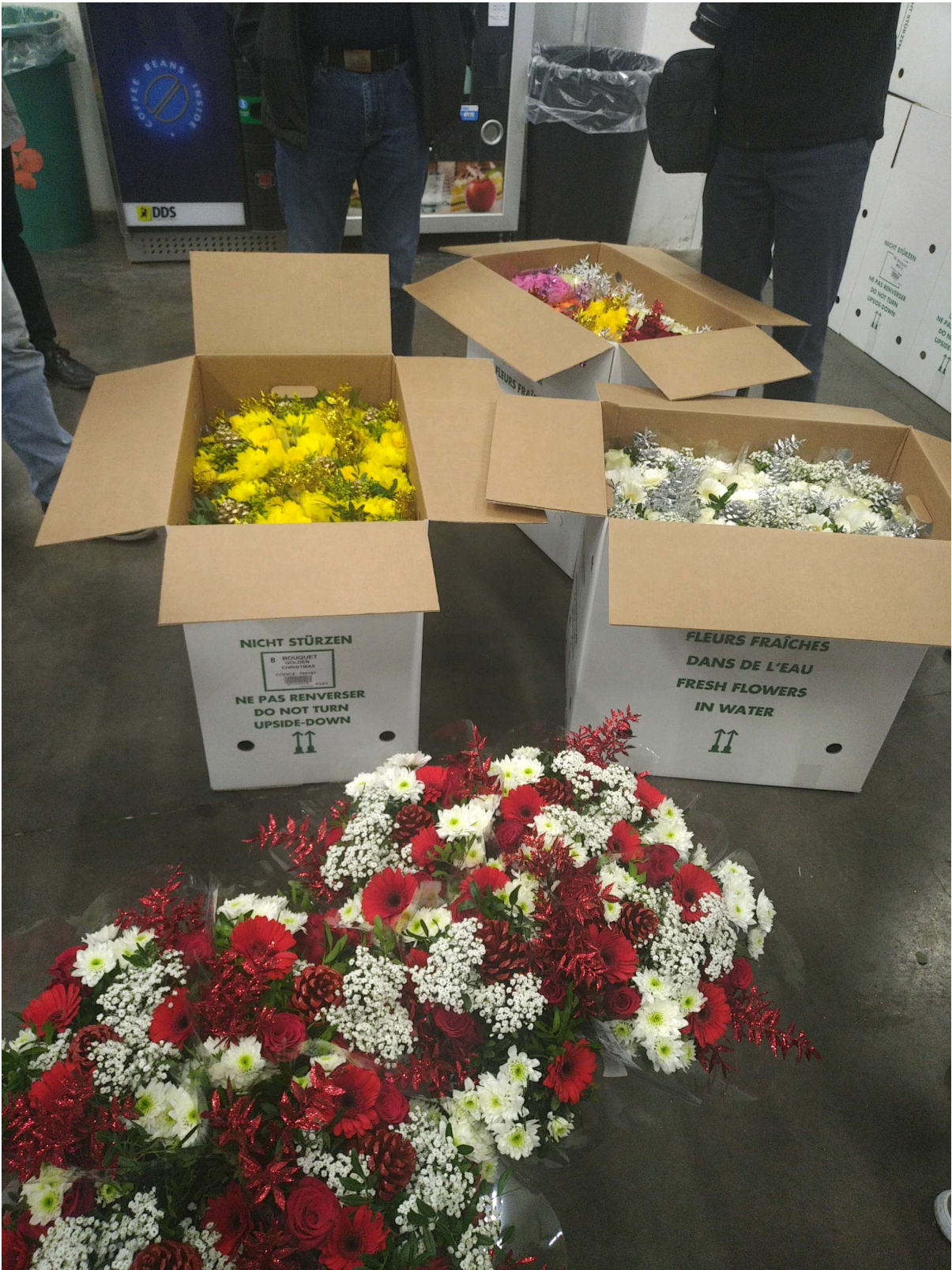
Astoņi pušķi kastē